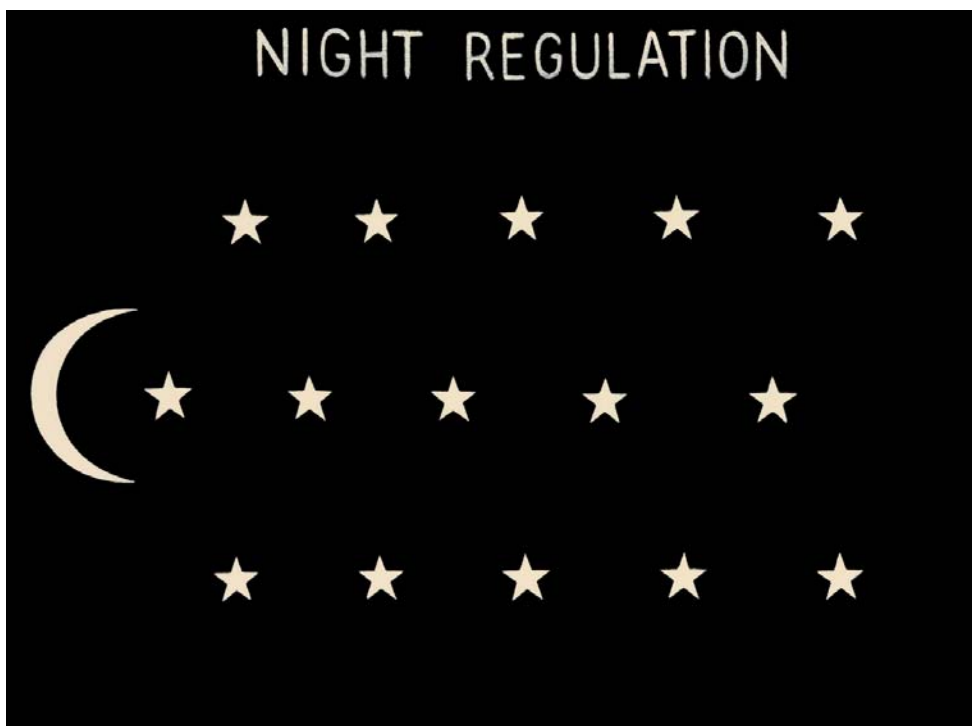
Marco Neri, 2008, Night Regulation, acrilico su tela di lino, cm. 46x61